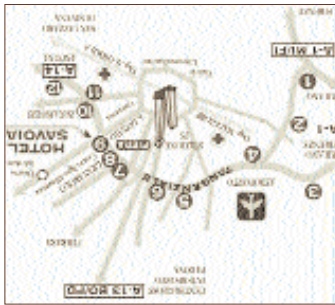
ALFA ASSERMAN S.p.A.

JACQUES GAMELIN "NOUVEAU RECUEIL D'OSTÉOLOGIE ET DE MYOLOGIE DES SINÈ D'APRÈS NATURE". TOULOUSE. L'IMPRIMERIE I. F. DESCLASSAN, 1779.