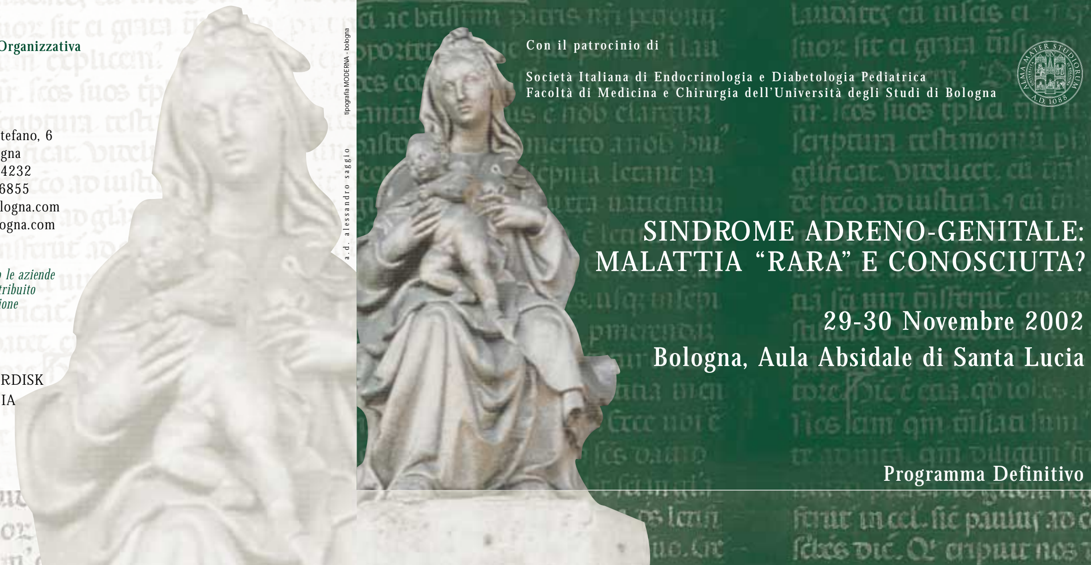
tipografia MODERNA - bologna a. d. alessandro saggio