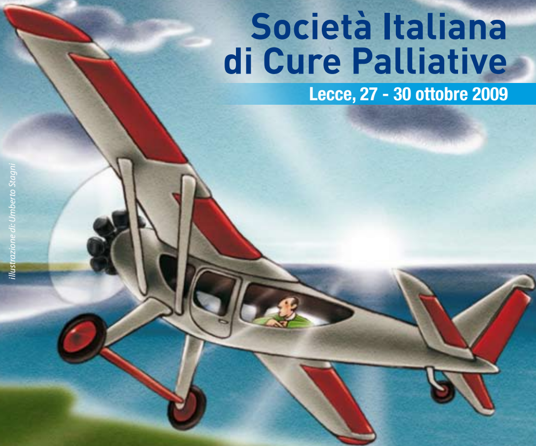
illustrazione di Umberto Stagni